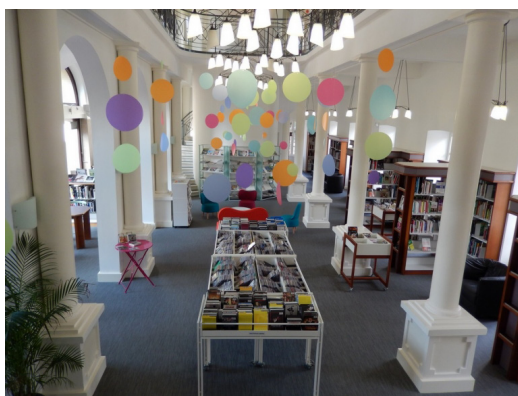
Médiathèque de Saint-Marcelin

Parmi les lauréats du programme de revitalisation des centres-bourgs, plusieurs démarches artistiques ont ainsi été imaginées de manière à intégrer les habitants.